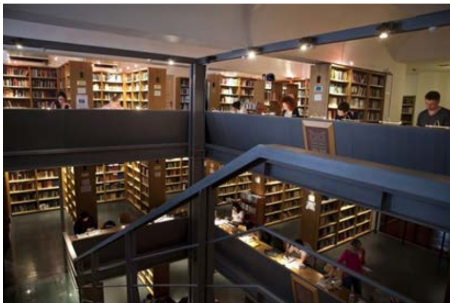
Βιβλιοθήκη του Παντείου Πανεπιστημίου

Μεταξύ των χωρών που έχουν επικυρώσει και εφαρμόσει τις διατάξεις της Συνθήκης του Μαρακές είναι και η Ελλάδα, έπειτα από τη συνεργασία με το Συνεργατικό Δίκτυο Διαθετών Προσβάσιμης Βιβλιογραφίας. Έτσι, κάναμε πράξη όχι μόνο τον κατάλογο προσβάσιμων βιβλίων αλλά και τη δυνατότητα διαδανεισμού, όπως έχουν οι χρήστες χωρίς εντυποαναπηρία.